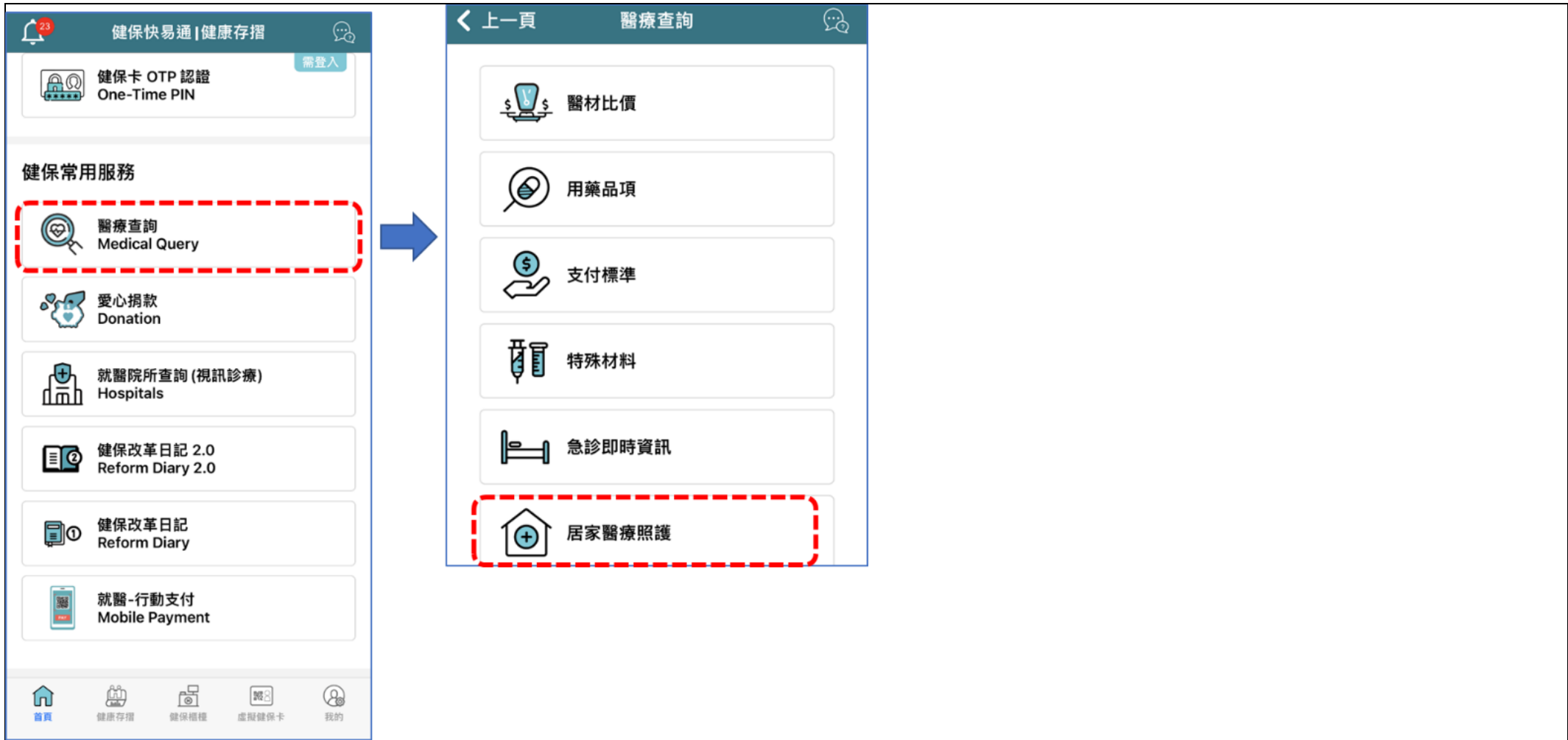
▲ 中央健康保險署健保快易通 APP 查詢路徑